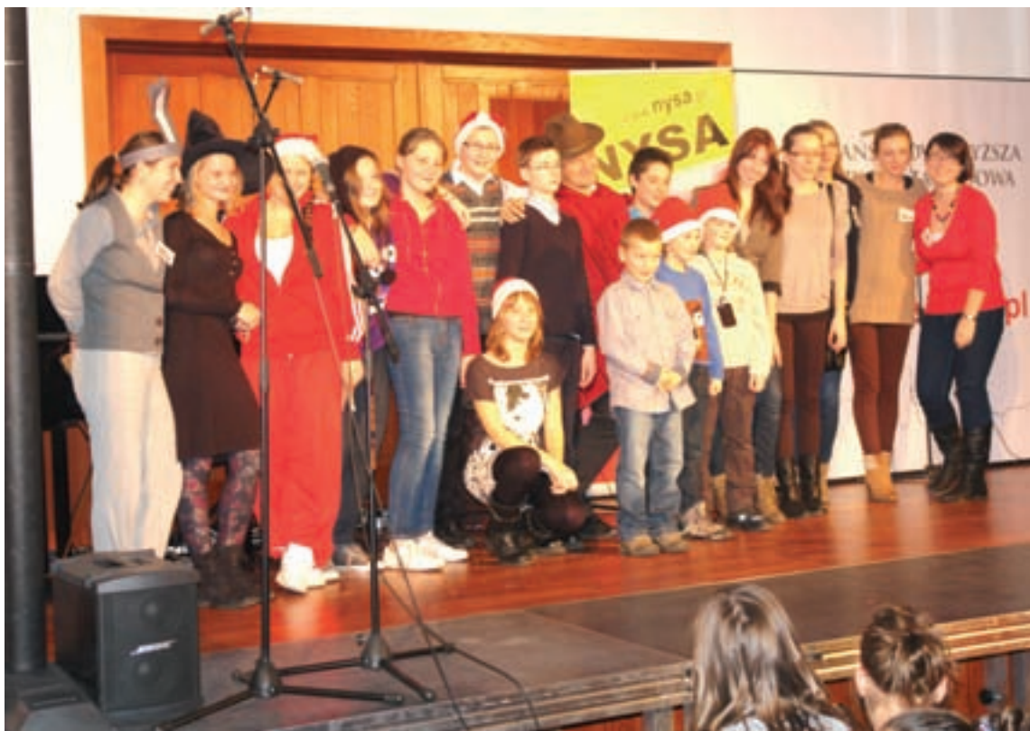
Na scenie PWSZ (ulica Obronców Tobruku) wystawiono sześć sztuk w języku angielskim

Państwowa Wyższa Szkoła Zawodowa w Nysie oraz Urząd Miejski w Nysie w czwartek 6 grudnia zorganizowały konkurs teatralny pt. Anglojęzyczne Formy Artystyczne