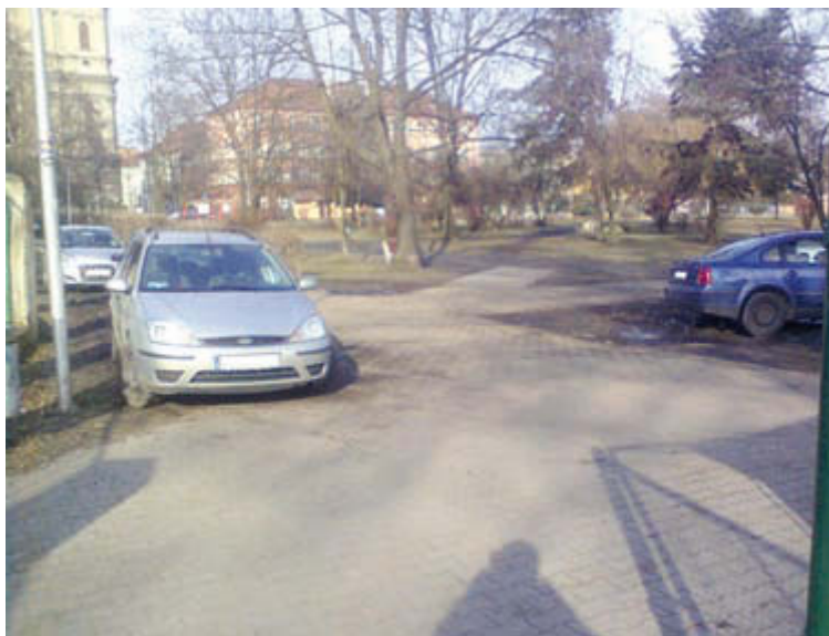
Samochody rozjeżdżają błotniste alejki pl. Paderweskiego

Plac jest w stanie fatalnym, a dodatkowo teraz jeszcze błotniste podłoże rozjeżdżyły samochody. Czy tak ma wyglądać skwer w centrum miasta?