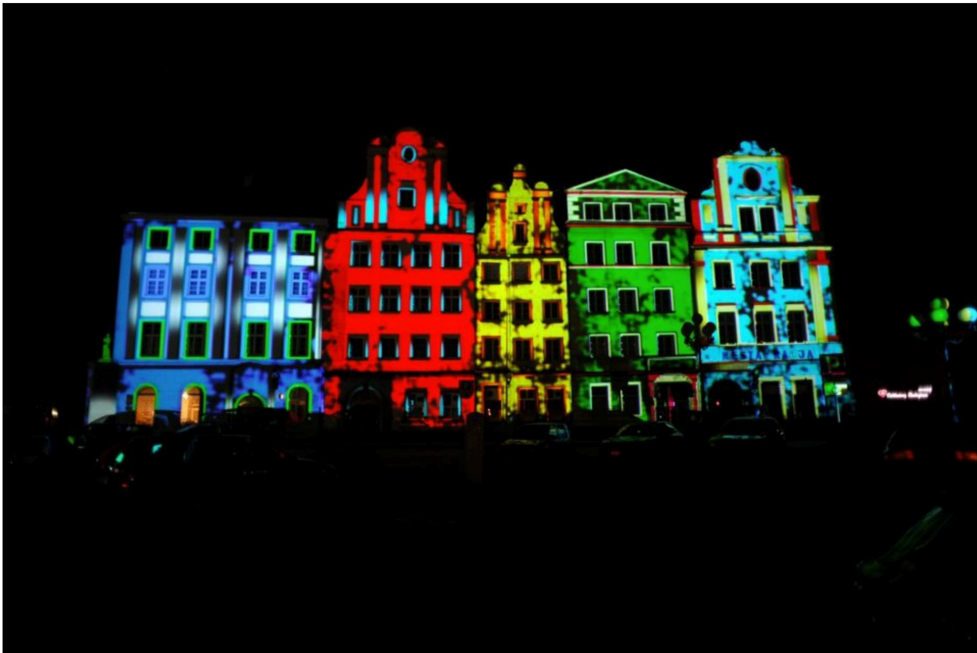
Kamienice na rynku w Nysie