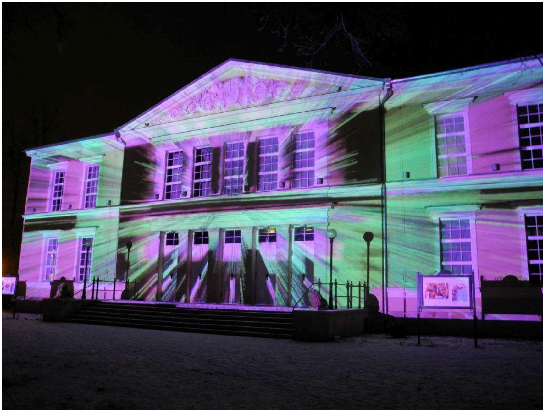
Teatr Animacji w Cieplicach Zdrój