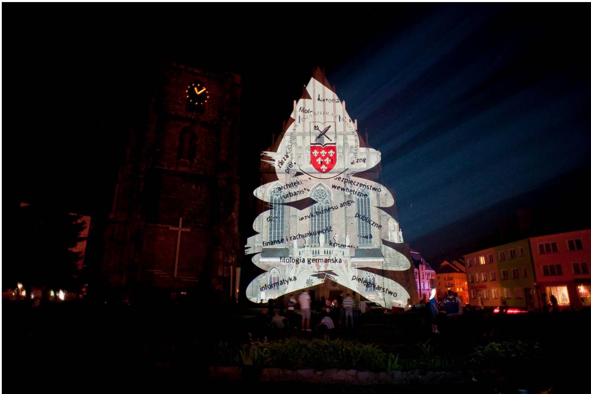
Katedra w Nysie (Bazylika mniejsza)